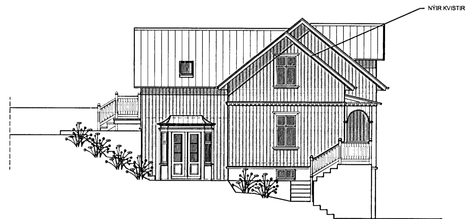
ÚTLIT NORÐAUSTURHLIÐ 1:100

Byggingarlýsing fyrir einbýlishús að Hverfisgötu 23, Hafnarfirði. Staðgreinir : 1400-1-44900230. Upprunalegur hönnuður okunnur. Byggingarár 1920.